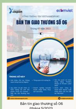
Bản tin giao thương số 06 (tháng 5/2023)