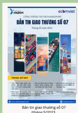
Bản tin giao thương số 07 (tháng 5/2023)

Để xem thêm cơ sở dữ liệu xuất nhập khẩu, doanh nghiệp vui lòng truy cập: