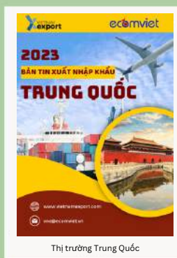
Thị trường Trung Quốc