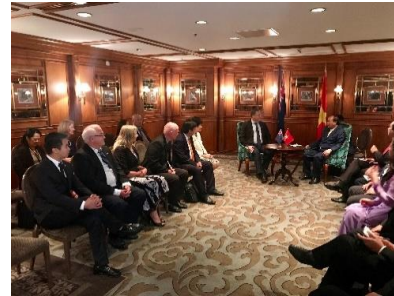
NZTC gặp Thủ tướng Nguyễn Xuân Phúc

Đặc biệt gần đây, nhân chuyến thăm chính thức New Zealand tháng 3/2018, Thủ Tướng Chính phủ Nguyễn Xuân Phúc đã tiếp lãnh đạo NZTC. Cũng nhân dịp này, Lễ ký Biên Bản Ghi nhớ (MOU) về hợp tác chiến lược giữa NZTC với Tập đoàn Sovico Holding (Sovico) đã diễn ra tại Auckland, Trung tâm Thương mại của New Zealand.