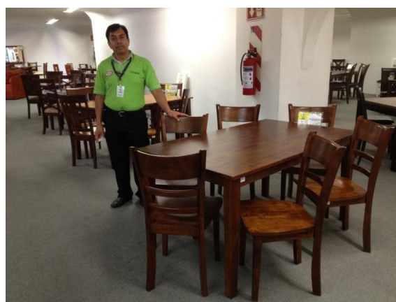
Bàn ghế gỗ của Việt Nam tại siêu thị Viana, Mê-hi-cô