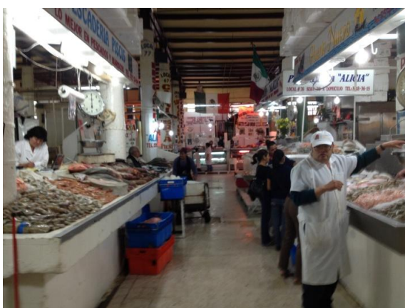
Chợ cá San Juan, Mê-hi-cô, bán tôm và cá tra của Việt Nam