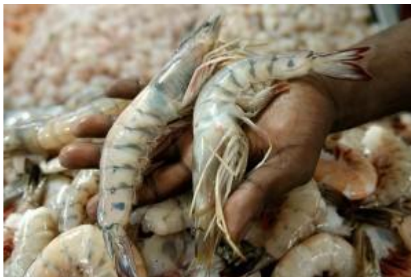
Hội chứng, gây tử vong hàng loạt lên đến một trăm phần trăm loại giáp xác, trang trại nuôi tôm xuất hiện ở miền nam Trung Quốc.

Ngày 18/04/2013, Mexico đã quyết định tạm đình chỉ nhập khẩu từ Trung Quốc, Việt Nam, Malaysia và Thái Lan tôm dưới dạng sống, nguyên liệu, nấu chín, đông, khô hoặc bất kỳ hình thức nào của loài tôm sú (Black Tiger) và tôm thẻ chân trắng (White-Litopenaeus vannamei), do các quốc gia trên có một bệnh mới ảnh hưởng đến loài giáp xác và gây chết hàng loạt. Với mục đích bảo vệ ngành công nghiệp nuôi trồng thủy sản tôm trong nước, Bộ Nông nghiệp, Chăn nuôi, Phát triển nông thôn, Thủy sản và Thực phẩm Mexico (SAGARPA) đã ra lệnh hành động phòng ngừa.