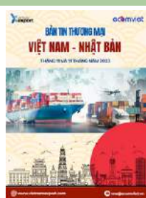
Bản tin thương mại