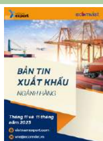
Bản tin ngành hàng