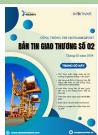
Bản tin giao thương

Để xem thêm cơ sở dữ liệu xuất nhập khẩu, doanh nghiệp vui lòng truy cập: