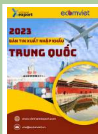
Thị trường Trung Quốc