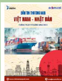
Bản tin thương mại