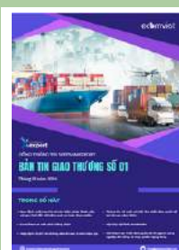
Bản tin giao thương

Để xem thêm cơ sở dữ liệu xuất nhập khẩu, doanh nghiệp vui lòng truy cập: