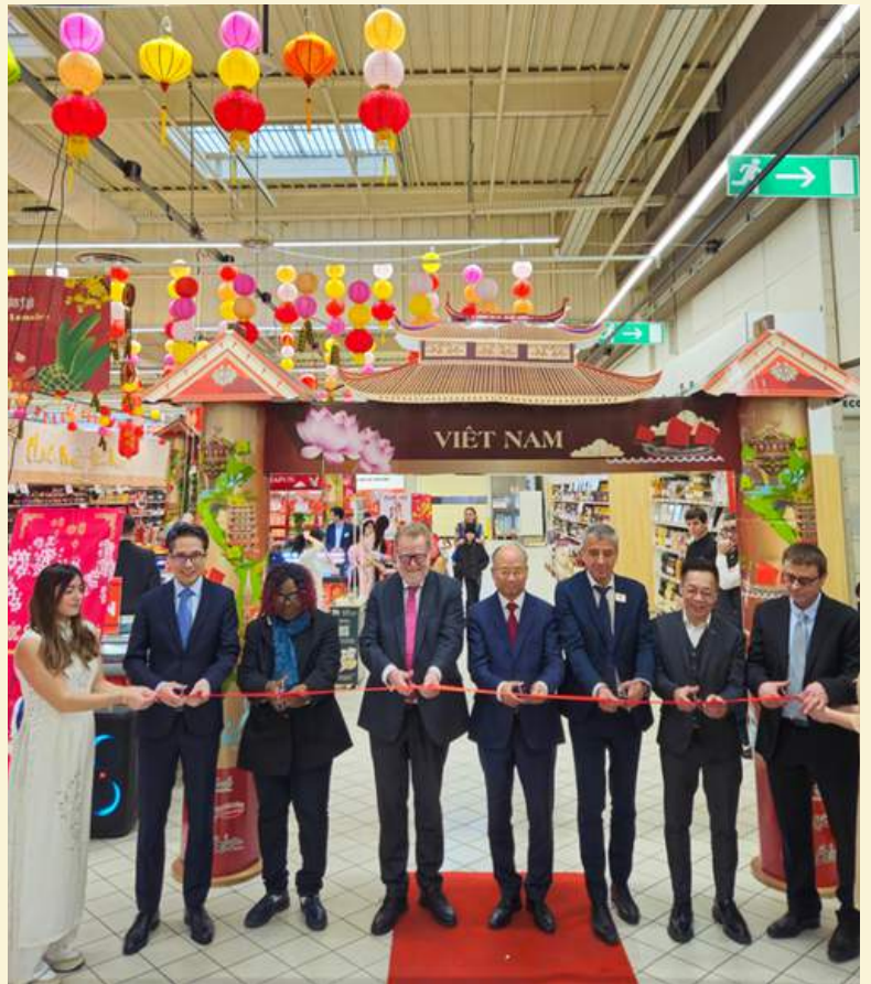
(Tuần hàng vinh danh Tết Nguyên đán Việt Nam tại Pháp)

Sau 3 năm triển khai Tuần hàng vinh danh Tết Nguyên đán Việt Nam tại Pháp và hàng loạt các Tuần lễ hàng Việt Nam trên khắp nước Pháp được tổ chức thông qua các hệ thống đại siêu thị thuộc các tập đoàn bán lẻ lớn nhất Pháp là Carrefour, E.Leclerc và Sys U... người tiêu dùng nước sở tại đã biết đến hàng Việt Nam.