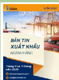
Bản tin ngành hàng