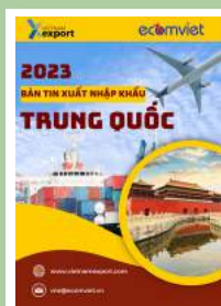
Thị trường Trung Quốc