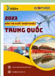
Thị trường Trung Quốc