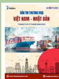
Bản tin thương mại