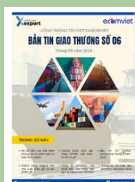
Bản tin giao thương

Để xem thêm cơ sở dữ liệu xuất nhập khẩu, doanh nghiệp vui lòng truy cập: