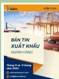
Bản tin ngành hàng