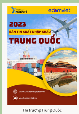
Thị trường Trung Quốc