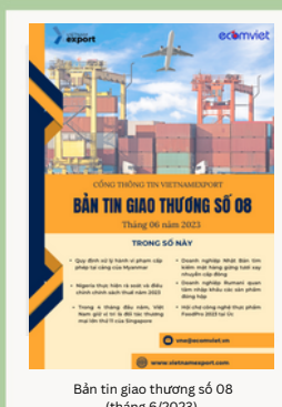
Bản tin giao thương số 08 (tháng 6/2023)