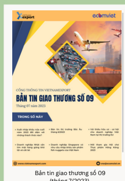
Bản tin giao thương số 09 (tháng 7/2023)

Để xem thêm cơ sở dữ liệu xuất nhập khẩu, doanh nghiệp vui lòng truy cập: