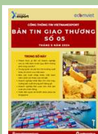
Bản tin giao thương

Để xem thêm cơ sở dữ liệu xuất nhập khẩu, doanh nghiệp vui lòng truy cập: