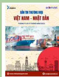
Bản tin thương mại