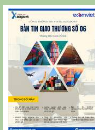
Bản tin giao thương

Để xem thêm cơ sở dữ liệu xuất nhập khẩu, doanh nghiệp vui lòng truy cập: