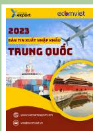
Thị trường Trung Quốc