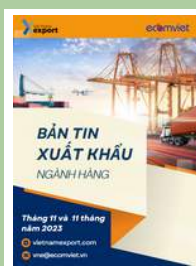
Bản tin ngành hàng