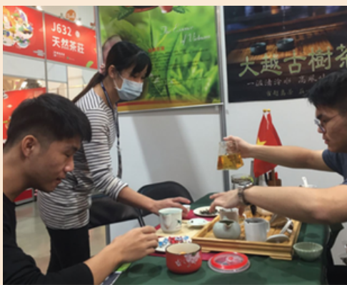
(Khách nếm trà Việt Nam tại Triển lãm trà quốc tế Đài Bắc năm 2022)