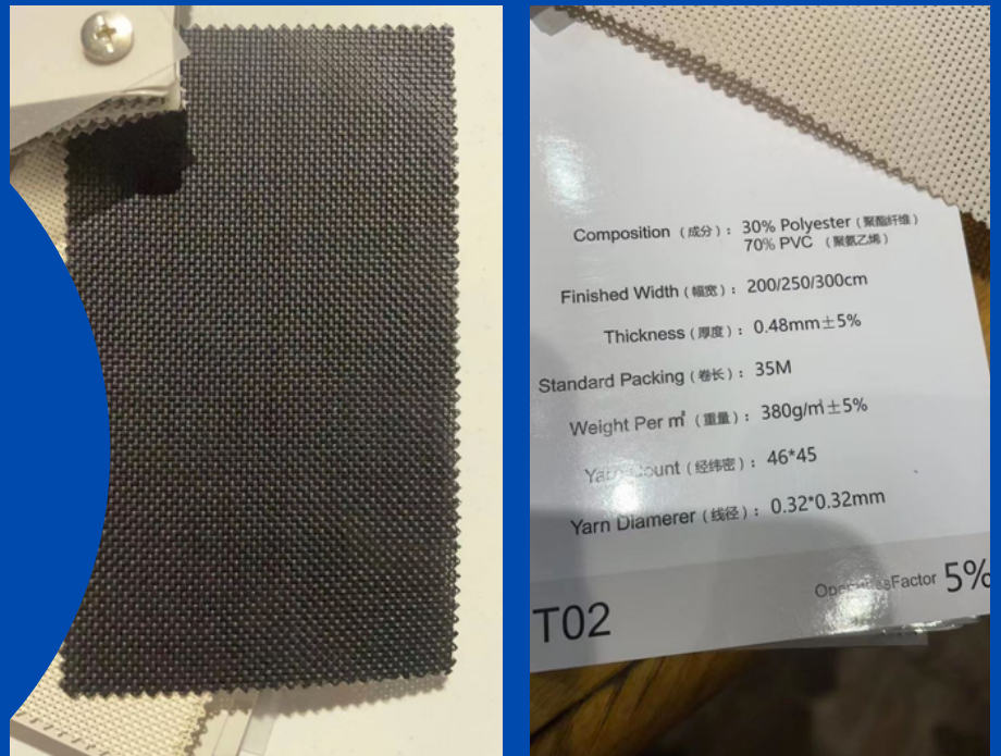
(Mẫu vải do bên đối tác cung cấp)

Doanh nghiệp Hồng Huy (Đài Loan) liên hệ với Thương vụ Văn phòng Kinh tế Văn hóa Việt Nam tại Đài Bắc đề nghị giới thiệu nhà cung ứng vải chống nắng của Việt Nam để đặt hàng xuất khẩu đi Đức.