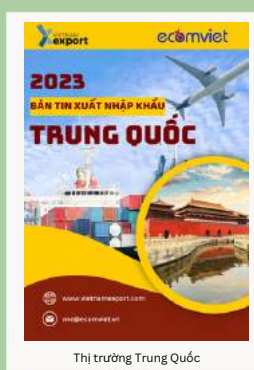
Thị trường Trung Quốc