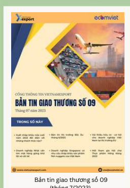
Bản tin giao thương số 09 (tháng 7/2023)