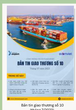
Bản tin giao thương số 10 (tháng 7/2023)

Để xem thêm cơ sở dữ liệu xuất nhập khẩu, doanh nghiệp vui lòng truy cập: