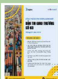
Bản tin giao thương

Để xem thêm cơ sở dữ liệu xuất nhập khẩu, doanh nghiệp vui lòng truy cập: