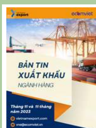
Bản tin ngành hàng