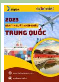
Thị trường Trung Quốc