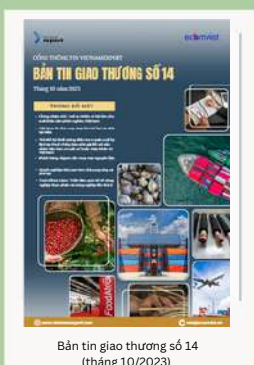
Bản tin giao thương số 14 (tháng 10/2023)