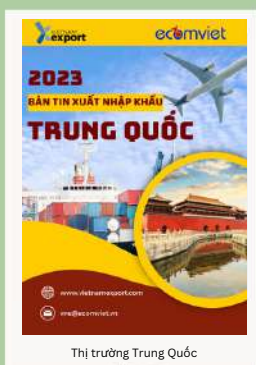
Thị trường Trung Quốc