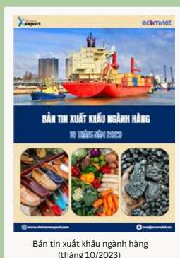
Bản tin xuất khẩu ngành hàng (tháng 10/2023)

Để xem thêm cơ sở dữ liệu xuất nhập khẩu, doanh nghiệp vui lòng truy cập: