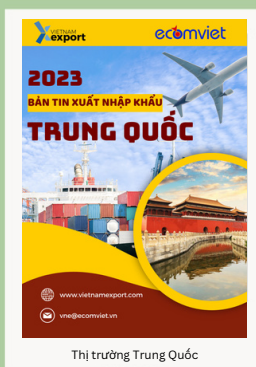
Thị trường Trung Quốc