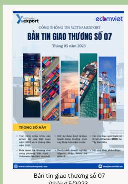
Bản tin giao thương số 07 (tháng 5/2023)