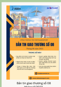
Bản tin giao thương số 08 (tháng 6/2023)

Để xem thêm cơ sở dữ liệu xuất nhập khẩu, doanh nghiệp vui lòng truy cập: