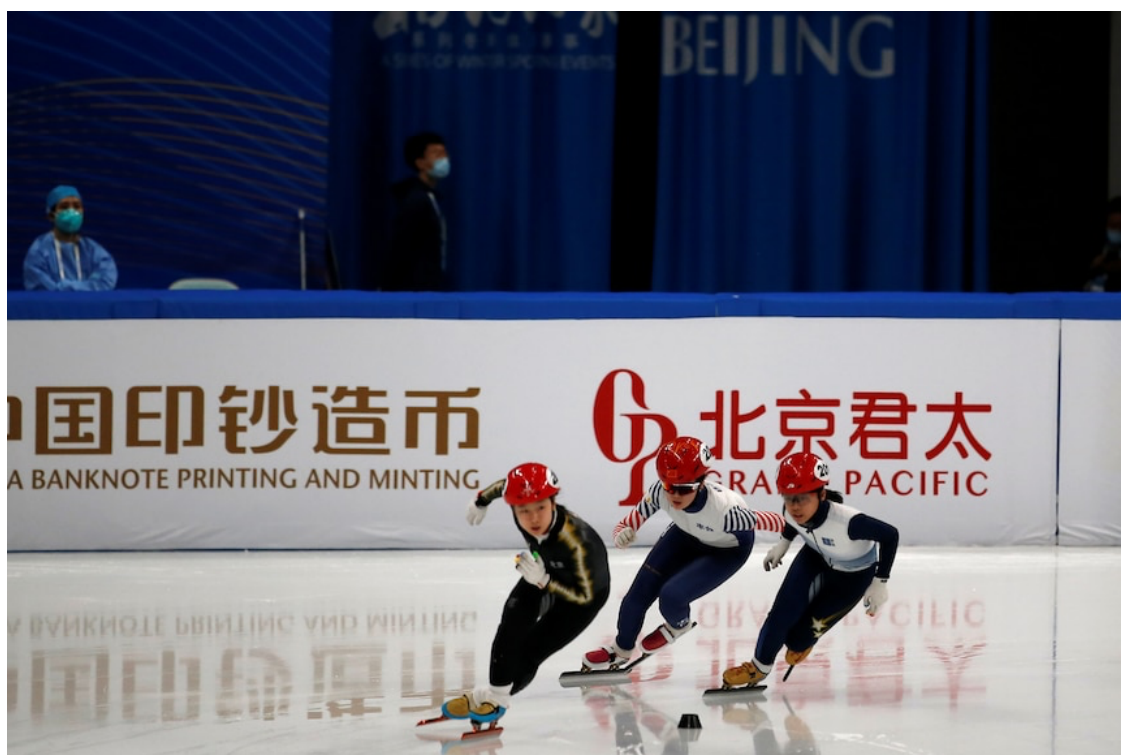
Tác động đối với nền kinh tế và ngân sách của Úc

Ngoài ra, có một yếu tố khác khiến Trung Quốc cắt giảm việc sản xuất thép mạnh hơn nữa vào cuối năm nay và đầu năm sau. Đó là việc giảm thiểu phát thải ô nhiễm môi trường để tổ chức Thế vận hội mùa đông diễn ra từ 04-20/2/2022. Các nhà chức trách Trung Quốc không muốn Thế vận hội mùa đông phải chìm trong mây khói ô nhiễm tại Bắc Kinh.