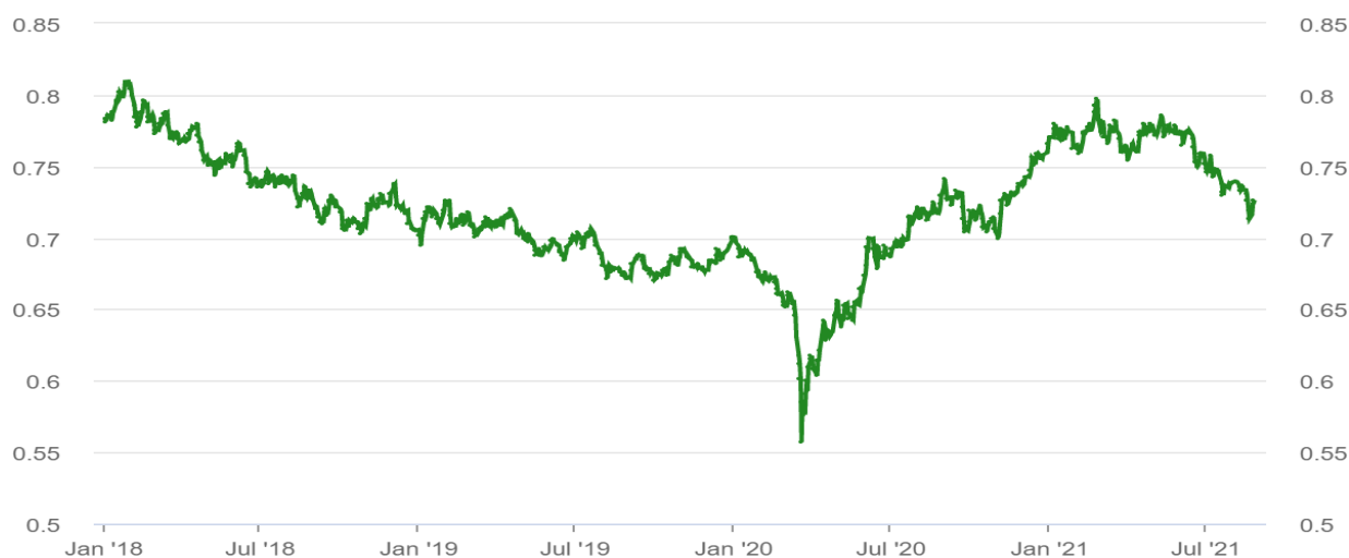
Graph of the AUD/USD exchange rate