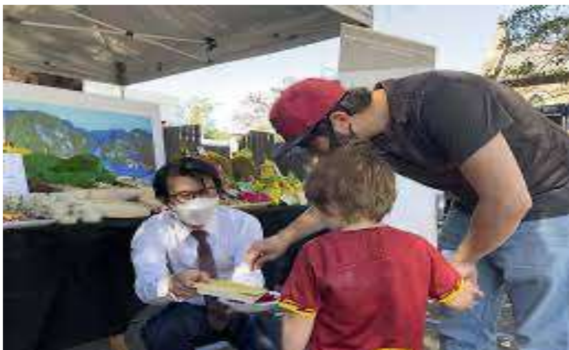
(Hình: Phó TLS/Trưởng Thương vụ mời bạn nhỏ Úc dùng thử thanh long ruột đỏ)