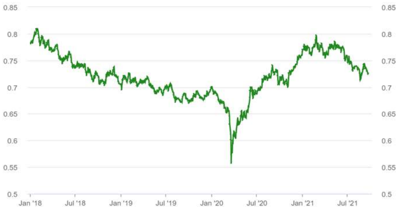
Graph of the AUD/USD exchange rate