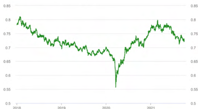
Graph of the AUD/USD exchange rate